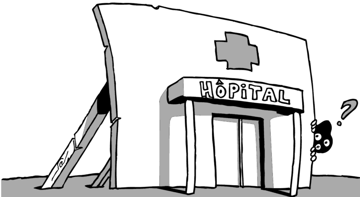
Illustration : Flush

[ SPECTACLES, CONFÉRENCE GESTICULÉE, ÉCHANGES SUR LE SYSTÈME DE SANTÉ ET LES HÔPITAUX ]